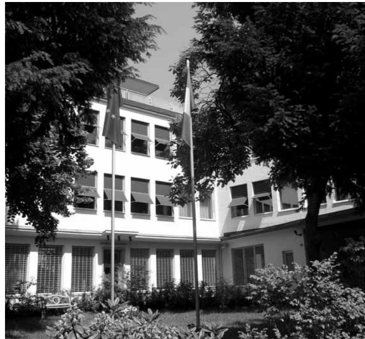
L'Istituto Italiano di Cultura di Monaco

O.O.: Sicuramente no, anzi la loro funzione andrebbe ampliata e questo vale in modo particolare per l'Italia. Negli anni ottanta vi fu un grande dibattito sulla funzione degli istituti di cultura a cui ho partecipato insieme ad altri a cui questo tema stava a cuore come l'ambasciatore Sergio Romano, per esempio. Risultato di quella riflessione fu un disegno di legge che scrissi nell'88 per la riforma di