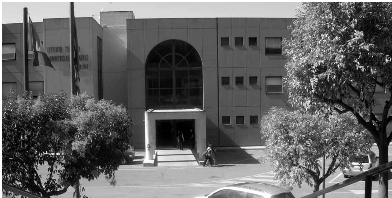
Terni: Istituto Tecnico Commerciale Statale "Federico Cesi"

esami di riparazione. In pratica, chi durante l'anno aveva preferito passeggiare per le vie del centro o giocare al calcio alla lettura della Divina Commedia o alla risoluzione di un'equazione di secondo grado, veniva lasciato in una sorta di limbo degli studenti, obbligato ad affrontare gli esami di riparazione a settembre.