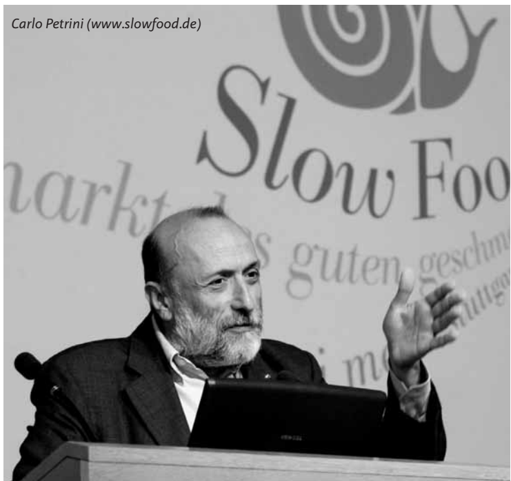
Carlo Petrini ( www.slowfood.de )

Der Slow Food Gedanke wurde vor 20 Jahren in Italien geboren. Oft hört man dazu die Geschichte, dass der Beginn von Slow Food aus einem Buffet traditioneller Gerichte bestand, das als Protest gegen die Eröffnung des ersten McDonald's vor der Spanischen Treppe in der Città