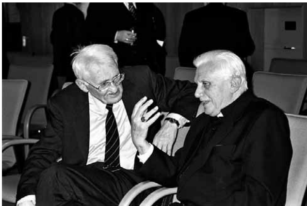
J. Habermas e Benedetto XVI

È davvero impossibile per una società secolarizzata l'autoregolazione di importanti principi sociali come, appunto, quello della solidarietà o altro quando ormai non c'è più nulla in cui vale la pena di credere. La democrazia rischia senz'altro di soffocare all'interno di uno Stato anti-