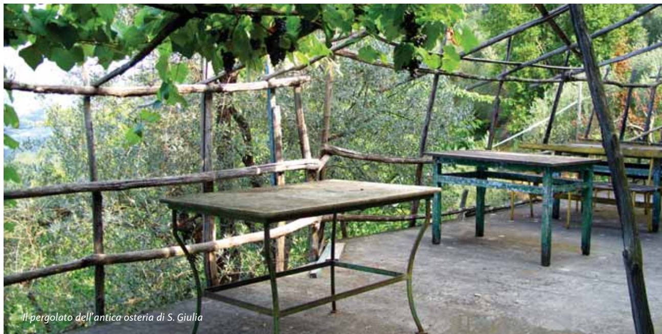
Il pergolato dell'antica osteria di S. Giulia

Ma ciò che maggiormente colpisce, nell'ambito di una visita alla chiesa di Santa Giulia è il momento dell'uscita verso il sagrato, quando si è investiti da un'ondata di luce azzurra, e si apre, netta, decisa, non interrotta, la visione sul mare. Solo il mare si vede dall'uscita della chiesa, e, sopra, il cielo; in basso le chiome verdeggianti di alcuni alberi chiudono la visuale sulla costa. Per vedere il profilo della battigia, valutare la profondità del panorama e dargli movimento, occorre avanzare di alcuni metri sul sagrato, magari fin sotto il leccio o fino alla scalinata d'ardesia: da lì si può vedere la linea della spiaggia, il biancheggiare della risacca, e i tetti grigi di alcune delle case che emergono tra il verde grigio degli olivi.