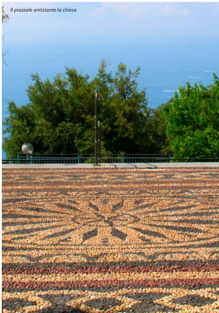
Il piazzale antistante la chiesa

chilometri di curve e controcurve della strada troppo stretta, ombreggiata, in alcuni tratti, dagli scuri boschi di castagno, o fiancheggiata, altrove, dai brevi terrazzamenti, le "fasce", coltivati a vigna o a olivo, sostenuti dagli alti muri in ardesia a secco, intravede solo poche case, spesso riparate e quasi nascoste dietro alte siepi, precedute da un vialetto, come se la tradizionale ritrosia dei liguri vietasse loro un troppo esplicito affacciarsi lungo la strada principale. Solo le case più recenti sono riparate da un cancelletto, per quelle antiche era, ed è tutt'ora, sufficiente garanzia di "privacy" la tortuosità del percorso e, soprattutto, la convinzione che nessuno abbia interesse o desiderio di accedervi.