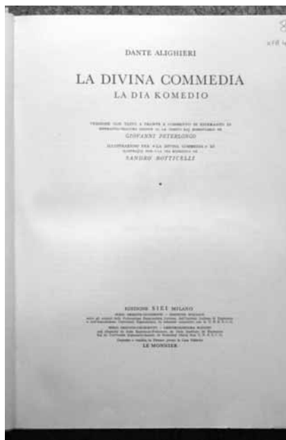
„La divina commedia“ in Esperanto

Juden und Weißrussen. Zamenhofs Idee ist es laut Breuninger gewesen, eine Sprache mit wenigen Regeln zu kreieren, „die Europäisches vereinigt“. Lauscht man den Esperanto-Klängen, kann man die Wortwurzeln der romanischen Sprachen hören, aus denen Esperanto zusammengesetzt ist. Für neue Worte der Sprache gibt es „transkontinental Linguisten, die sich damit befassen“, sagt Breuninger. Es gebe auch einen Esperanto-Duden. Der werde alle paar Jahre neu aufgelegt. ■